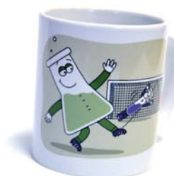
Illustration: Maïke Hettinger

Welches Element ist gesucht? Senden Sie Ihre Antwort bis zum 20. Dezember an nachrichten@gdch.de ; unter den richtigen Einsendungen lösen wir eine siegreiche aus und beantworten sie. Gewinne sind ein GDCh-Periodensystem als DIN-A0-Poster oder Mousepad oder die GDCh-Tasse mit dem Erlenmeyerchen. Das Erlenmeyerchen gibt's auch ohne Tasse in Plüsch. Die Auflösung steht im Januarheft.