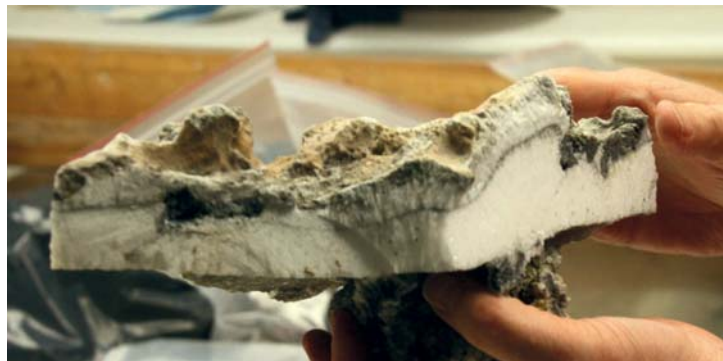
Eine Probe aus dem Auka-Quellgebiet: unten (weiß): Calcit, oben (grau): Anhydrit.

Die Schornsteine bestehen aus Calciumcarbonat, genauer Calcit. Die ausströmende Flüssigkeit enthält vor allem Calcium, Alkalimetalle, Bor, Silicium sowie Kohlendioxid und Methan. Verglichen mit anderen hydrothermalen Quellen sind zudem viele höhere Kohlen-