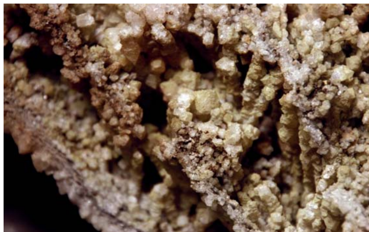
Anhydritkristalle von Unterwasserschornsteinen.